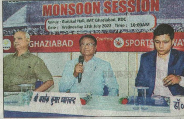
आईएमटी के गुरुकुल हॉल में आयोजित कार्यक्रम में बोलते अशोक कुमार ध्यानचंद।

कार्यक्रम का आयोजन आईएमटी और स्पोर्ट्स ए वे ऑफ लाईफ की ओर से किया गया। असेंबली में खेल संस्कृति के विकास के लिए प्रस्तावित प्रयासों पर विस्तृत चर्चा की गई। अशोक ध्यानचंद ने कहा कि आजकल बच्चे मोबाइल, टीवी को ज्यादा देखते हैं और